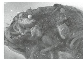
シーフードのトマトクリーム