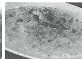
きのこベーコンのクリームパスタ