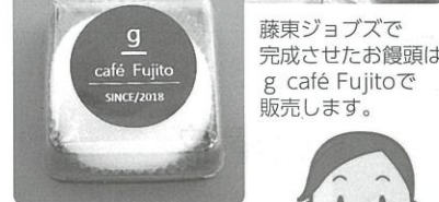
藤東ジョブズで完成させたお饅頭は、g café Fujitoで販売します。