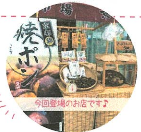
今回登場のお店です♪