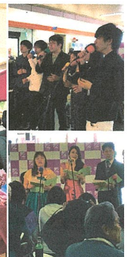
今年3/24(日)に開催された歌う！高蔵寺マーケットの様子