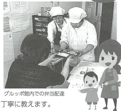
グルッポ館内での弁当配達

高蔵寺を「暮らしたいまち」に! コミュニティカフェは0歳から100歳まで誰もが集まれる場所へ! こどもとまちのサポートセンターは、子どもたちが笑って暮らせるように! そんなまちづくりを目指します。 皆さん、スタッフになって、グルッポから未来を発信してみませんか?