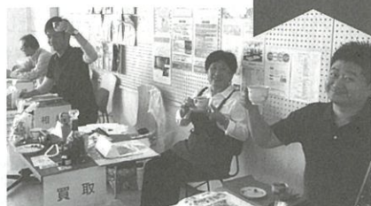
グルッポ Cha no Marche

----- どんな相談内容がありましたか? 「親の不動産を兄弟で共有しているが今からやっておくことは何か。親が亡くなったが相続はどうなるか。ほか保険の解約、確定申告のことなどです」。 ----- どのようなアドバイスをされましたか? 「お一人お一人で違うのでお話をじっくり聞かせてもらい、それにあうアドバイスをさせていただきました。おかげで、わかりやすかったとか、親身に相談してもらえたと感想をいただきました」。